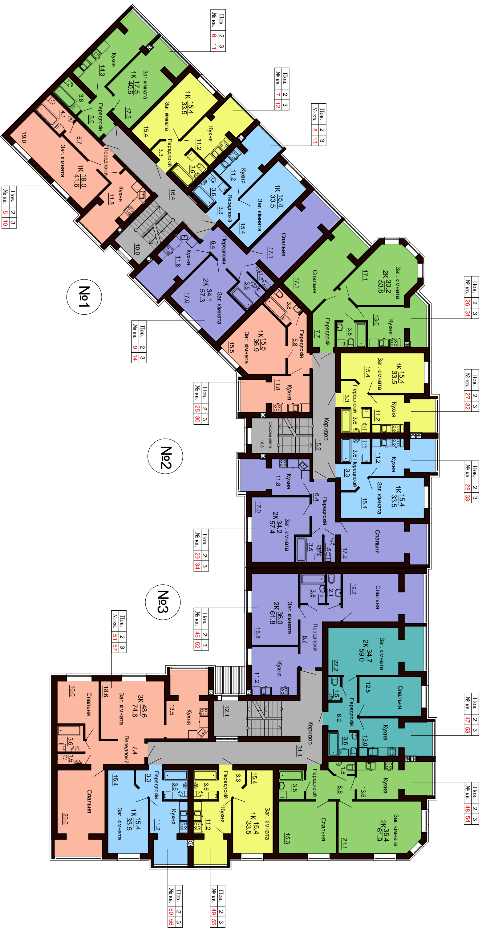
План 2-3-го поверху. Гетьманська, 12.