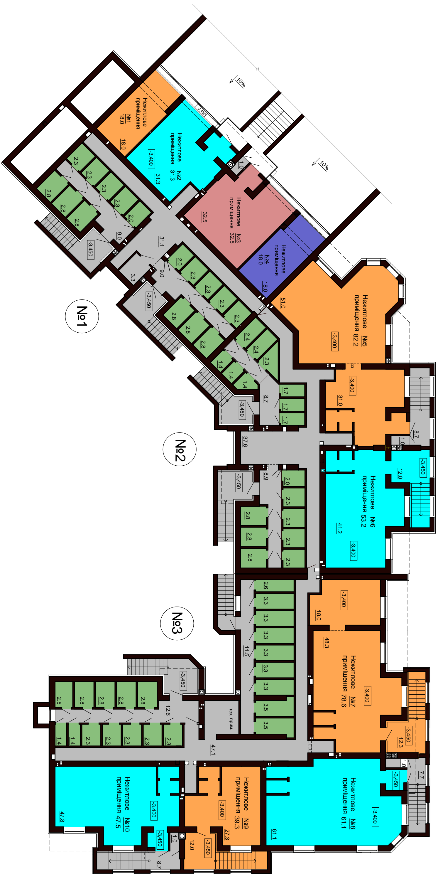
План підвального поверху. Гетьманська, 12.