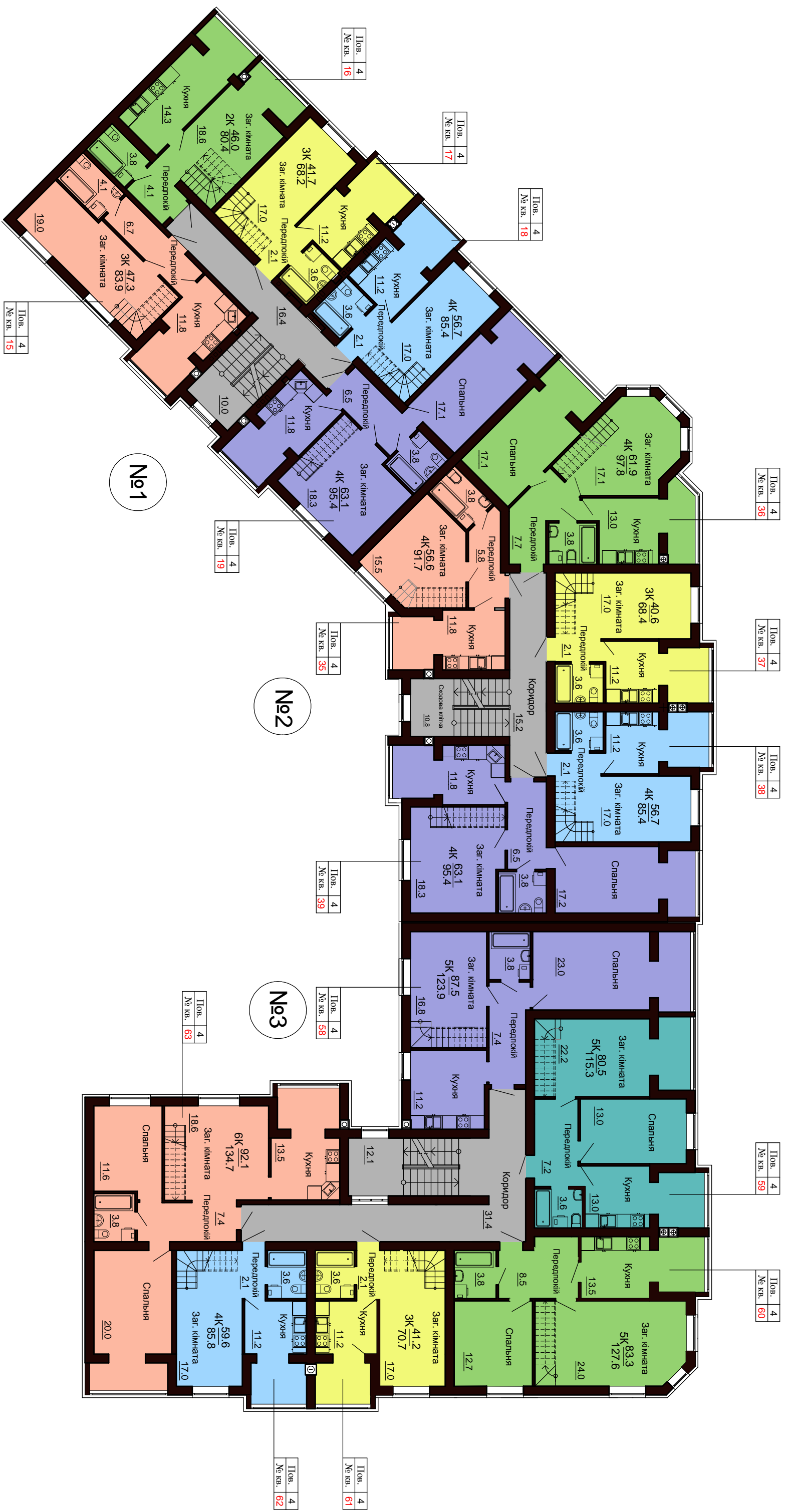
План 4-го поверху. Гетьманська, 12.