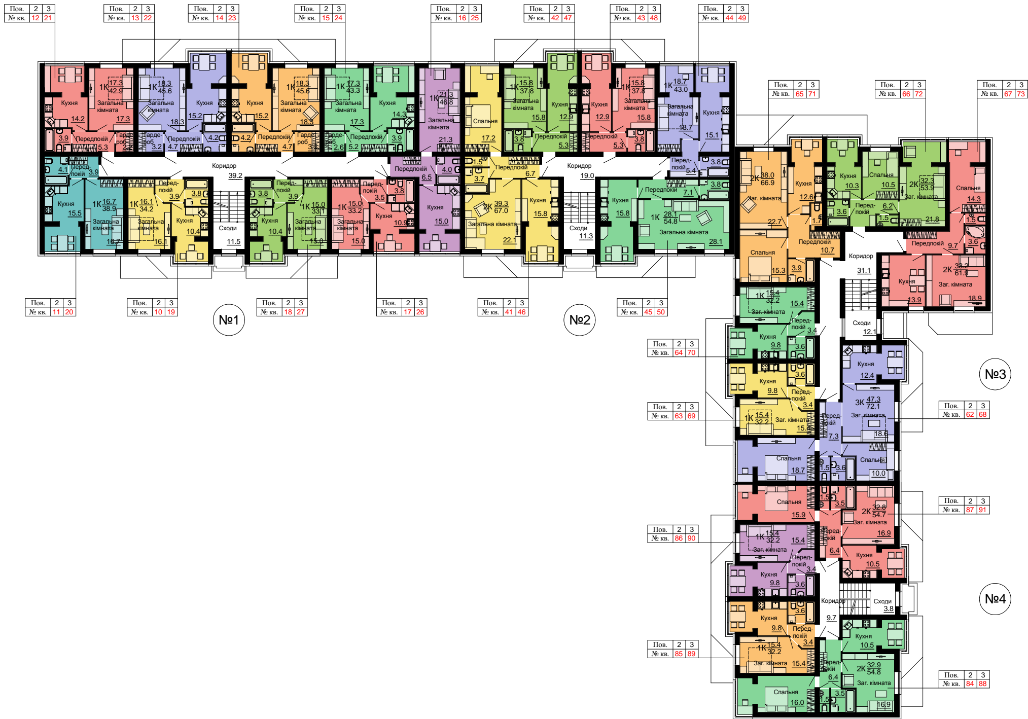
План 2-3-го поверху