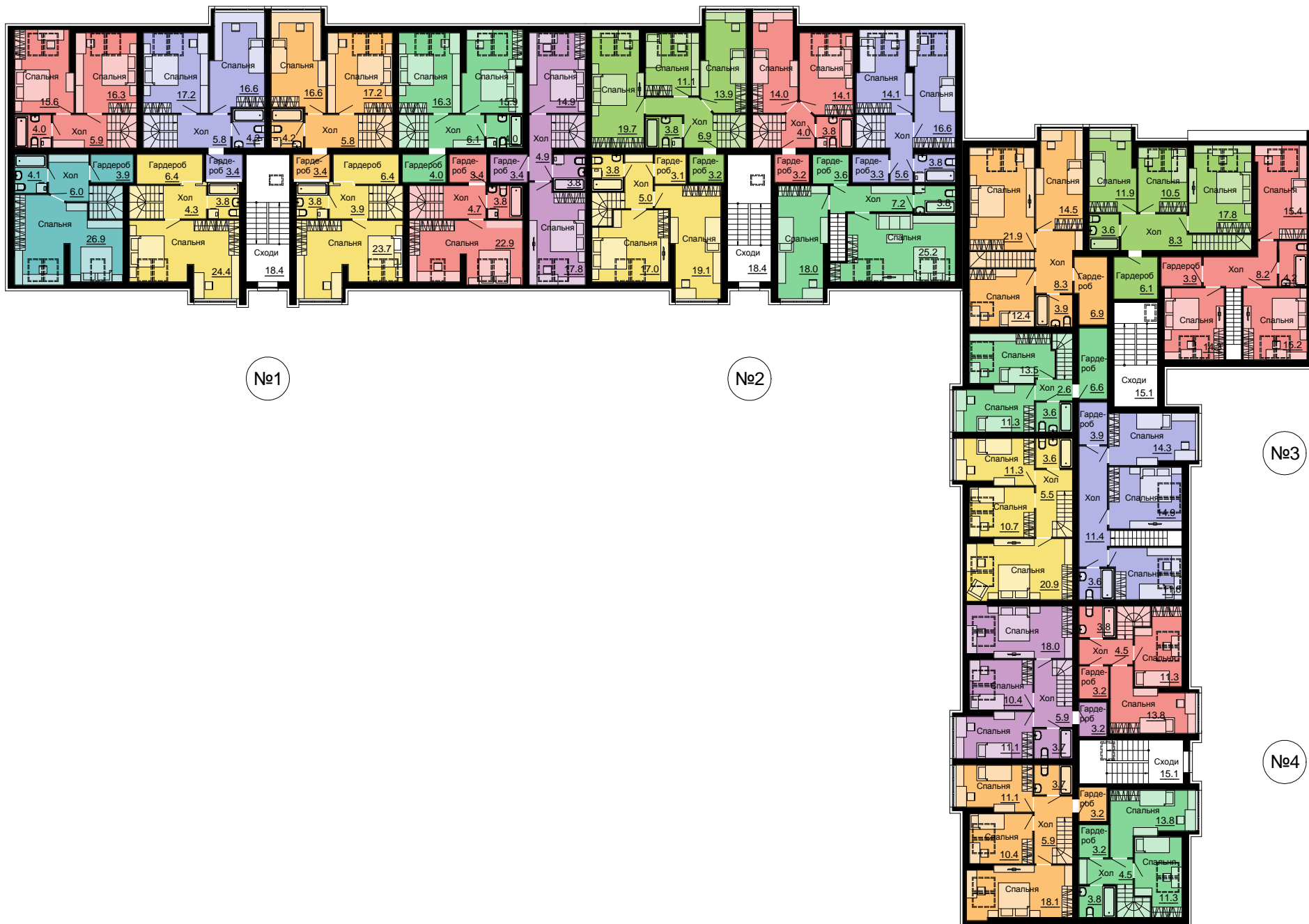
План мансардного поверху