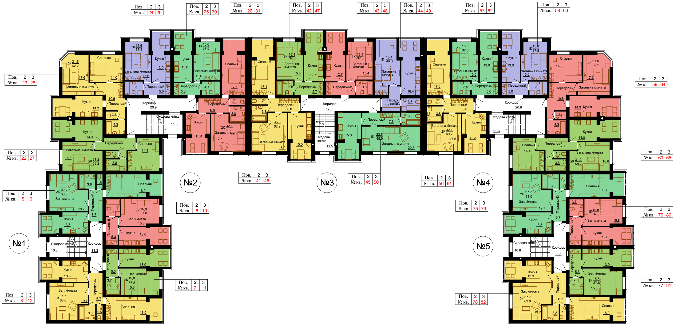
План 2-3-го поверху