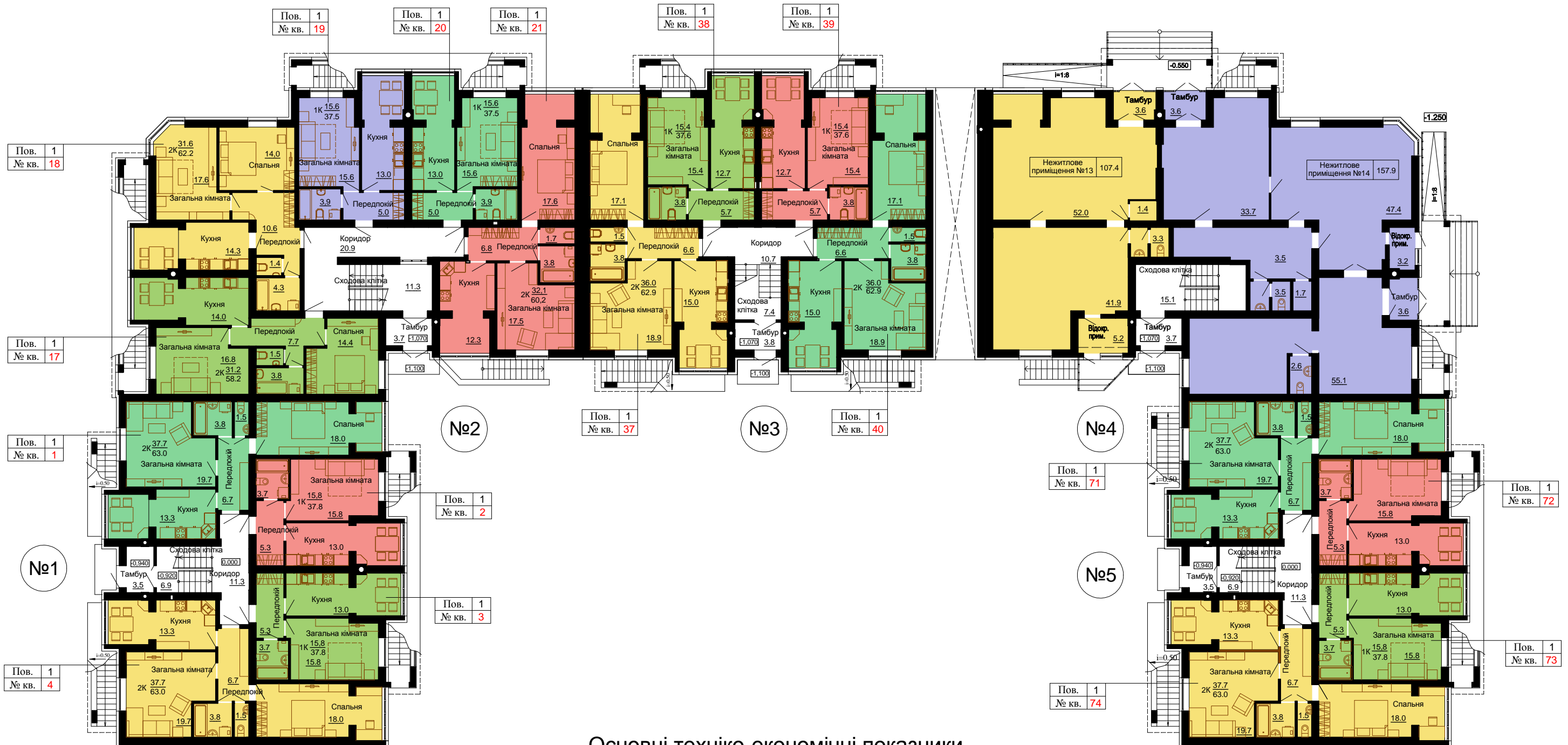
Основні техніко-економічні показники