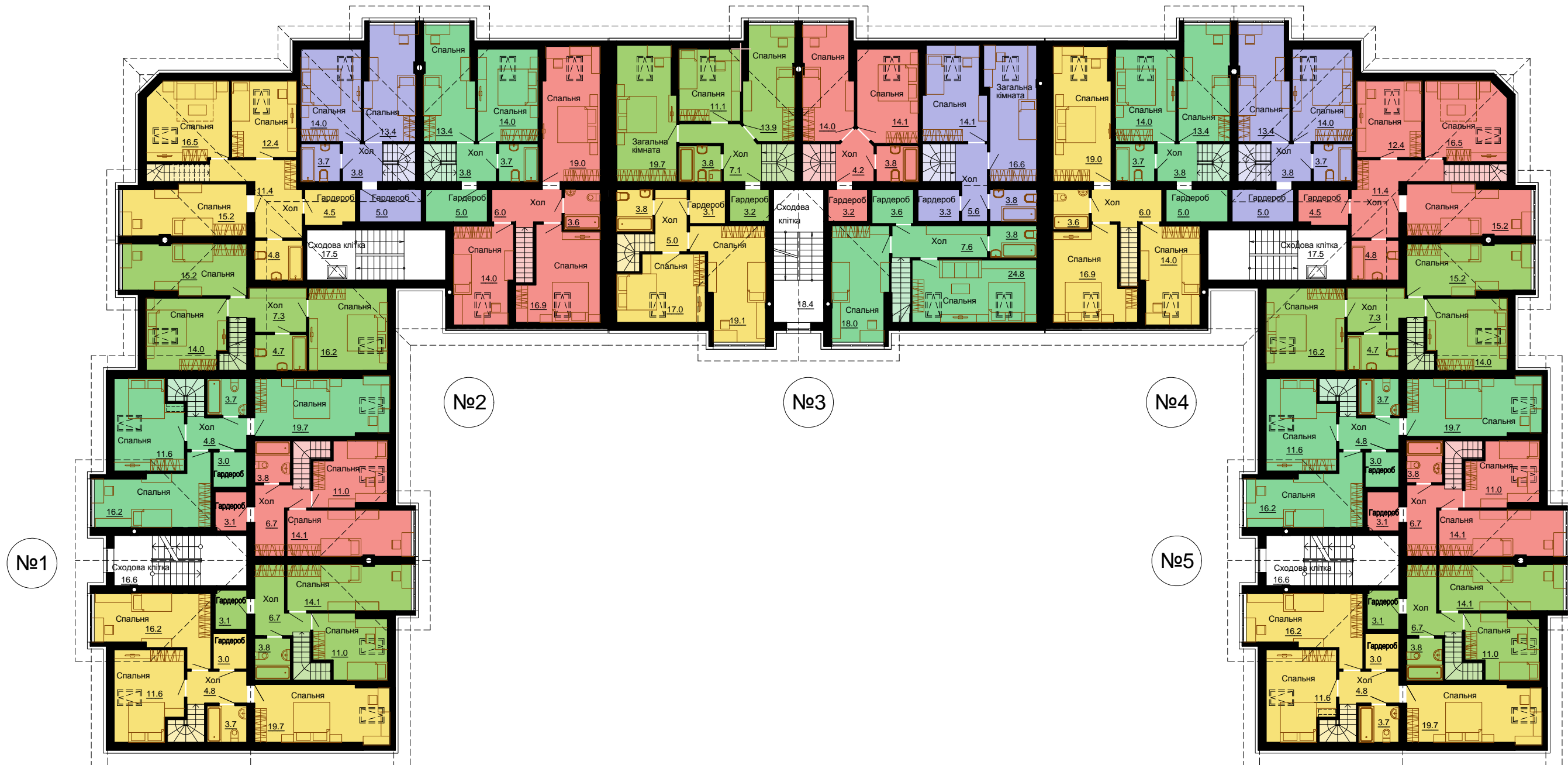
План мансардного поверху